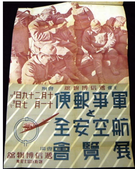
図3 「軍事郵便と航空安全展覧会」ポスター