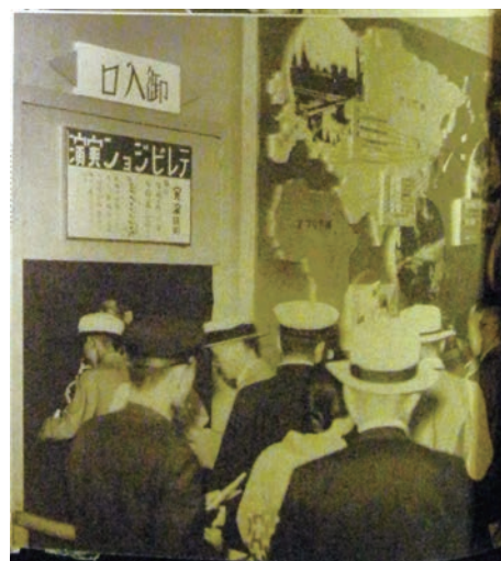
図4 「テレビジョン実演」に並ぶ人々

開催の1ヶ月前には、展覧会予告の記事が新聞に掲載され、直前にはテレビの公開を知らせる記事がやはり新聞に掲載された (40) 。テレビの受像実験の公開は、多くの人々を展覧会に呼び寄せることに