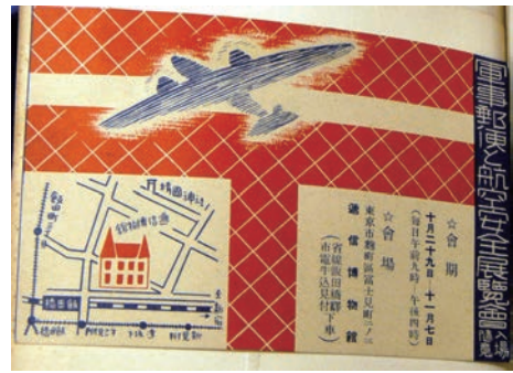
図2-2 「軍事郵便と航空安全展覧会」案内状（裏）

当時の国立博物館の代表的な存在といえる東京帝室博物館（現在の東京国立博物館）と東京科学博物館（現在の国立科学博物館）の来館者数とも比較してみよう。東京帝室博物館は、