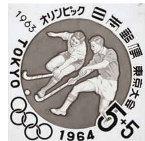
切手原画「オリンピック東京大会寄附金つき（ホッケー）」、1963年