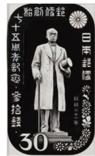
切手原画「郵政事業創始75周年記念」、1946年

概要：企画出品「日本の記念切手発行120年」に切手原画及び試刷16点を貸出・展示