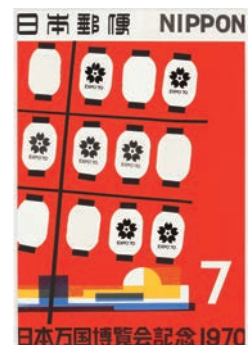
切手原画「日本万国博覧会記念」、1970年