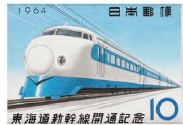
切手原画「東海道新幹線開通記念」、1964年