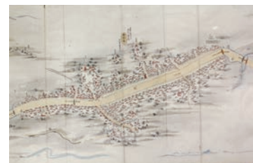
「中山道分間延絵図控 拾巻之内二（部分）」