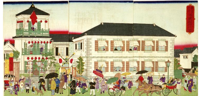
《東京名所 両国報知社図》 歌川広重(三代) / 郵政博物館蔵

本展関連イベントとして記念講演会を開催するほか、期間中は季節イベント「星月夜イベント」として、天体観望会や星占いなどの親子でお楽しみいただけるイベントも開催。楽しい企画が盛りだくさんです。