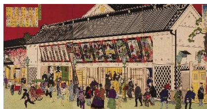
左:《鉄道馬車往復京橋煉瓦造ヨリ竹河岸図》歌川広重(三代) 右:《東京第一之劇場 新富座 大当ノ図》歌川広重(三代) ※すべて郵政博物館蔵