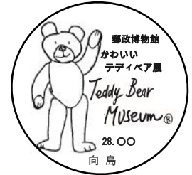
伊豆テディベアミュージアム柄 イメージ