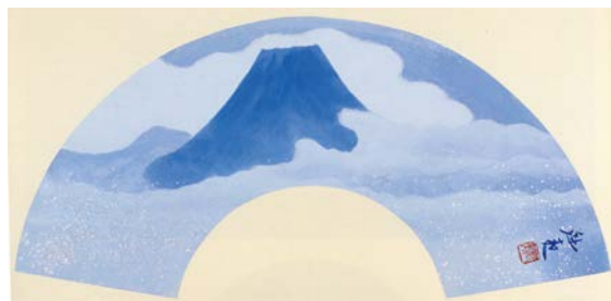
東山魁夷 《青富士》 扇面原画 平成 6 年 / 郵政博物館蔵