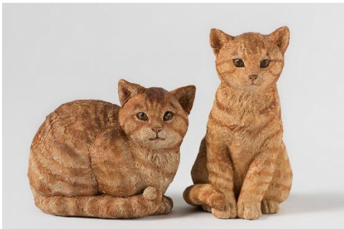
□3 ニュリヤとニュリ 彫刻家 : はしもとみお