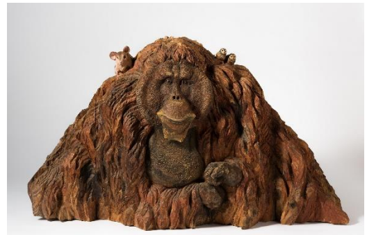
□4 キュー 彫刻家 : はしもとみお