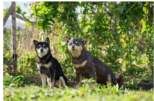
□2 月くん 彫刻家 はしもとみお