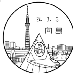
向島郵便局の風景入 日付印