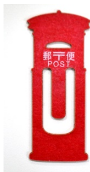
3月1日、2日限定で(マスキングテープ配付完了後) に来館者全員にプレゼントするポスト型クリップ