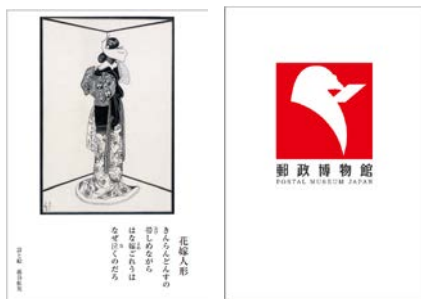
3月1日、2日限定で来館者全員に プレゼントするオリジナルポストカード 2種類