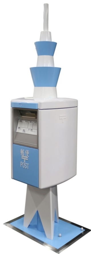
タワー型郵便ポスト ※投函は博物館開館日時に限る

また先着 250 名様以降のお客様にポストカード 2 種類とポスト型クリップをプレゼントします。さらにオープン 3 月 1 日(土)、2 日(日)には郵政博物館開館記念の小型記念日付印、3 月 1 日～5 月 25 日の間には開館記念特別展「一少女たちの憧れ—落谷虹児展」にちなみ、落谷虹児作「花嫁」をデザイン化した小型記念日付印押印のサービスを行います。