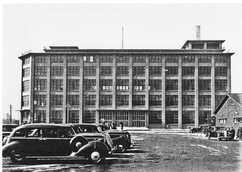
大阪中央郵便局外観