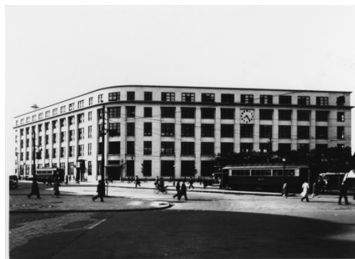
東京中央郵便局外観