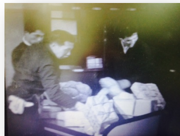
昭和 36 年の東京中央郵便局の映像

昭和 36（1961）年東京中央郵便局サークルだより（全通東京中郵支部教宣部製作・8 ミリ）のデジタル化画像をご覧になれます。東京中央郵便局のサークル活動の記録のほか、当時の郵便業務のようすも記録されています。